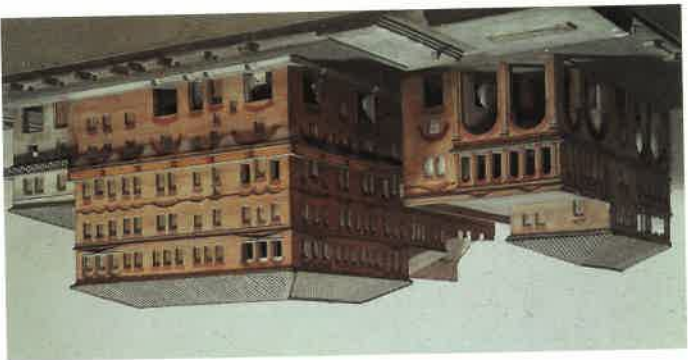
M2 Modell eines römischen Mietshauses